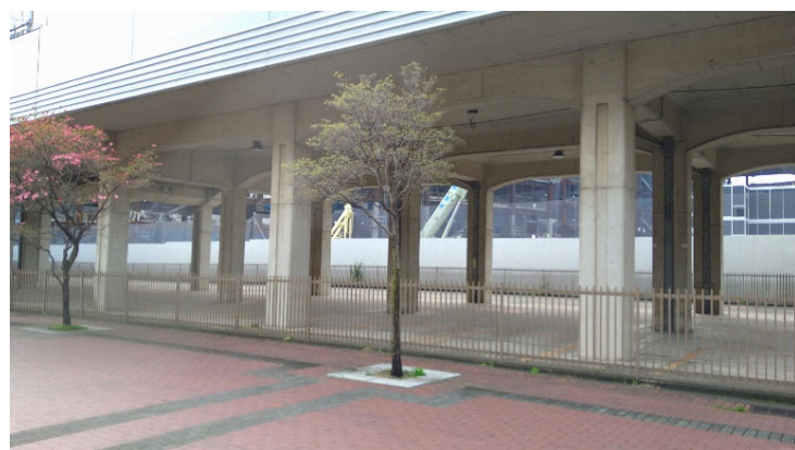
1 対象地とみなきたウォークの接続部