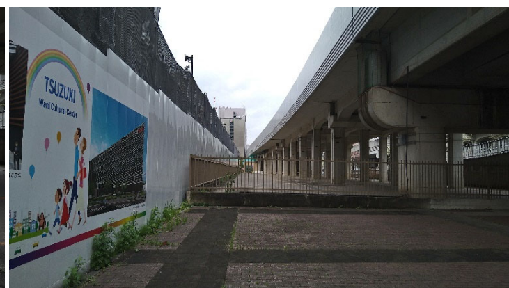
3 対象地と自転車及び歩行者専用道路の接続部