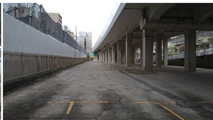
2 対象地と全天候型広場の接続部